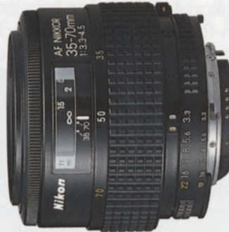
AF Zoom-Nikkor 35-70mm f/3,3-4,5