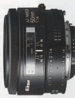
AF Nikkor 50mm f/1,4*