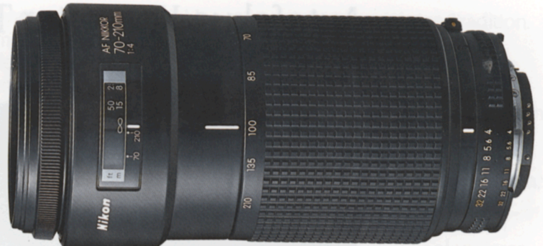
AF Zoom-Nikkor 70-210mm f/4