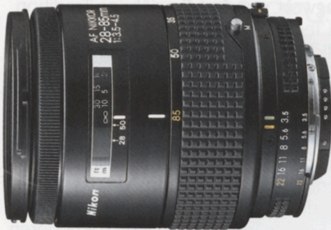
AF Zoom-Nikkor 28-85mm f/3,5-4,5*