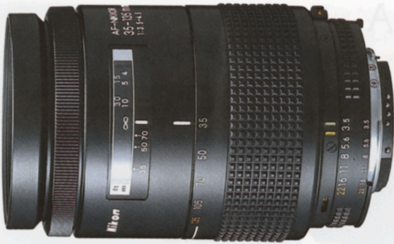
AF Zoom-Nikkor 35-135mm f/3,5-4,5*