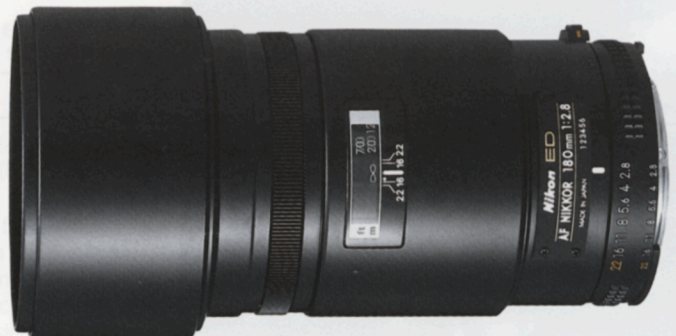
AF Nikkor 180mm f/2,8 IF-ED*