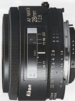
AF Nikkor 28mm f/2,8*