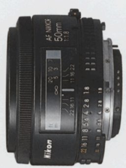
AF Nikkor 50mm f/1,8