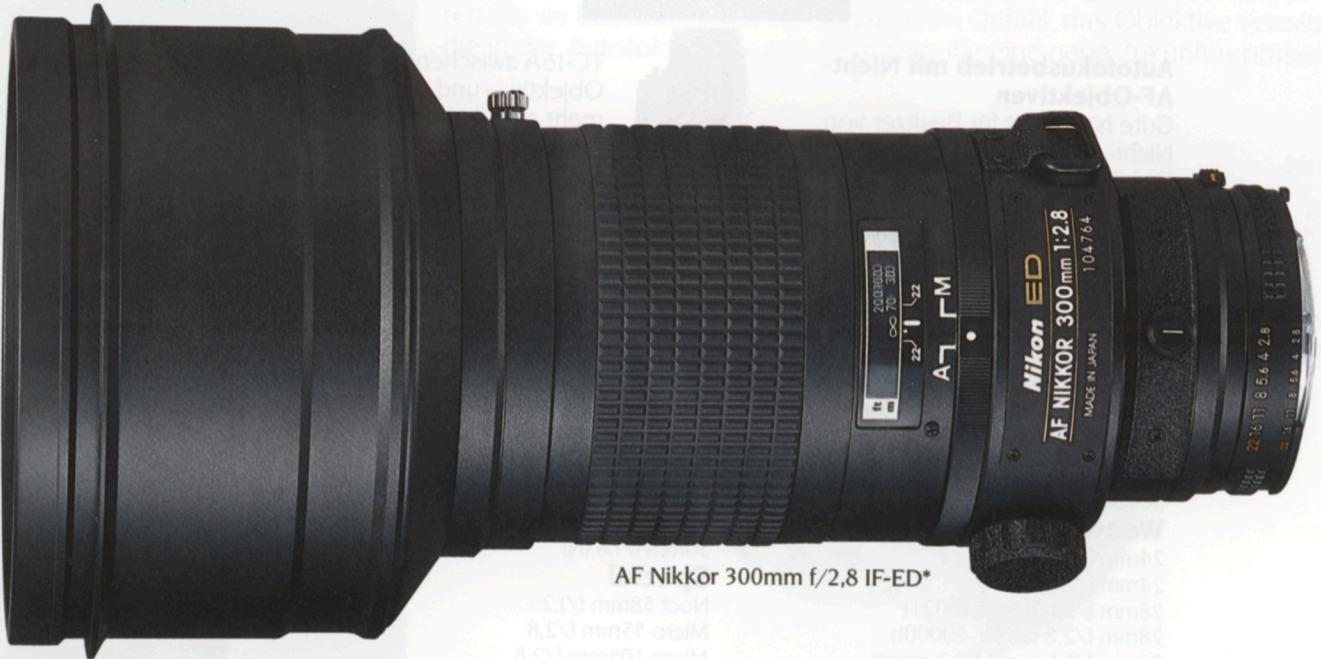
AF Nikkor 300mm f/2,8 IF-ED*