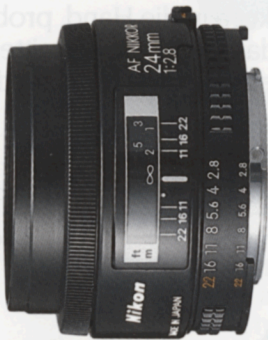
AF Nikkor 24mm f/2,8*