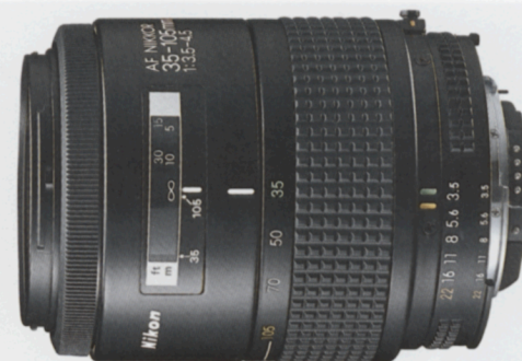
AF Zoom-Nikkor 35-105mm f/3,5-4,5*