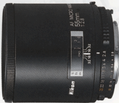
AF Micro-Nikkor 55mm f/2,8*